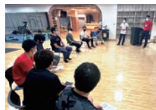
座学と実技で知見を深めます